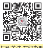
扫码关注 在线办理

徐州报业传媒集团官方网站,可在见报当天第一时间同步提供网上查询。在徐州日报、都市晨报、彭城晚报以外的其它媒体换版刊登,均无法提供官网查询,其发布的权威性、有效性、真实性无从保证。敬请谨慎选择。