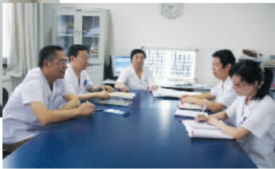
→ 病例讨论,制定出规范化治疗方案,并做到对每个病人的个体化最佳治疗。