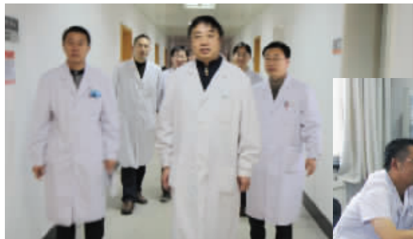
← 每周六上午科主任大查房