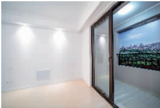
徐州 融创·玉兰公馆工法样板房实景图