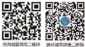
徐州城管微信二维码 徐州城管微博二维码