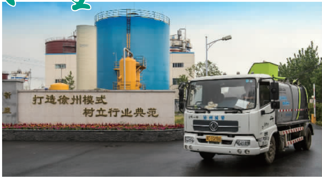
市餐厨垃圾处理厂负责市区范围内的餐厨废弃物实行集中收集、运输和无害化处置。

随着经济社会的发展和物质生活水平的提高，大街小巷各色饭店林立，不管是星级饭店还是街角饭馆，只要开门经营，都会产生泔水、油脂等餐厨废弃物。一个饭店产生的泔水可能还不算多，而一个城市所有饭店每天产生的餐厨废弃物总量十分惊人，它们的去向和“地沟油”常常联系在一起，让人们“舌尖安全”问题非常关注。不久前，一场2018“世界城市日公益行”活动，让市民代表们走进位于铜山大彭镇的徐州市餐厨垃圾处理厂，亲眼瞧瞧日常餐饮企业的餐厨废弃物是怎么变废为宝，为公众“舌尖安全”保驾护航的。记者从市城管局环卫处了解到，截至10月底，完成主城区餐厨废弃物收运协议签订3969家，处理餐厨垃圾107700.33吨，污水79702.88吨，沼气2302476方。