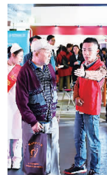
志愿者在现场服务