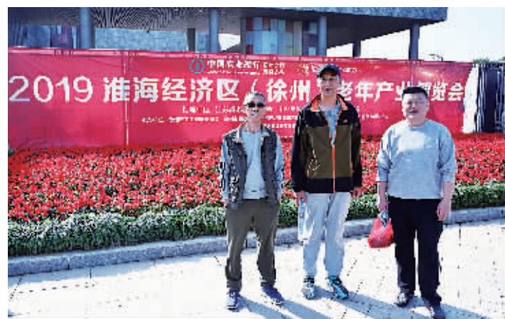
市民在老博会标语前合影