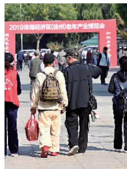
市民逛展收获颇丰