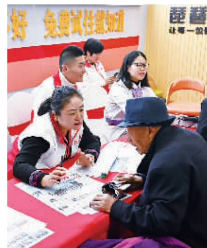
市民咨询养老机构