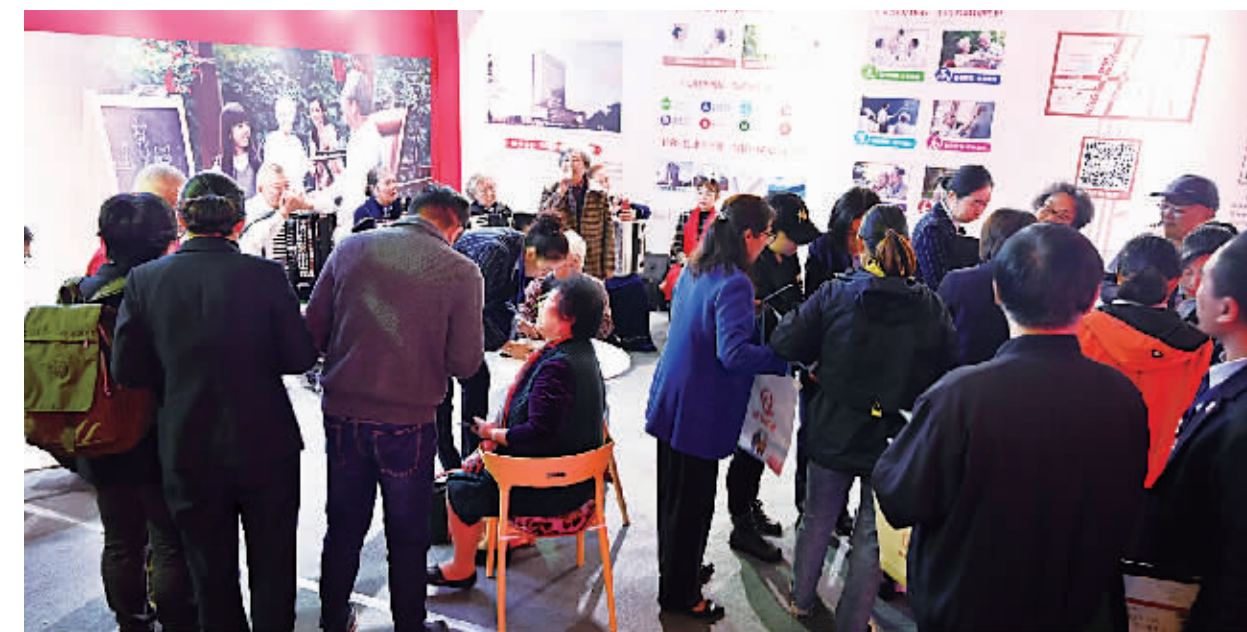
在佳和养老展区,市民认真咨询

徐州市泉山区博济老年公寓负责人表示,很多老人在展会上咨询后,已经到实地考察了。博济老年公寓西邻云龙湖风景区、南依泉山森林公园,老人大多对于周边环境都很满意。博济老年公寓还成立了博济康复医院,与老年公寓组合,入住老年人有病时可以得到及时医治。博济老年公寓还是徐州市首批护理保险协议服务机构,重度失能与重度失智人员入住重症照护区和失智症照护区,很大程度上减轻了家庭的负担。