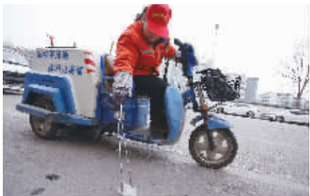
红帽子保洁员清洁路面垃圾。

除了科学管理和现代化机扫作业,该公司总经理曾玲玲还格外强调人才的重要性。该公司专门设置300多平方米的多功能培训中心,用于公司员工岗前培训和教育。公司中不乏高级管理人才和技术人才,公司近百名主管、标段经理、班组长在保洁行业方面拥有多年的服务经验。