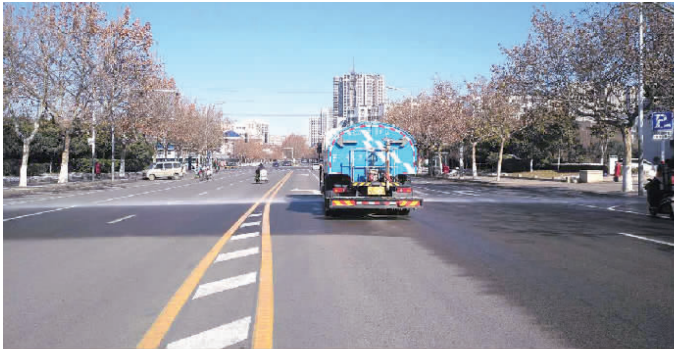
机械化作业保障道路整洁干净。