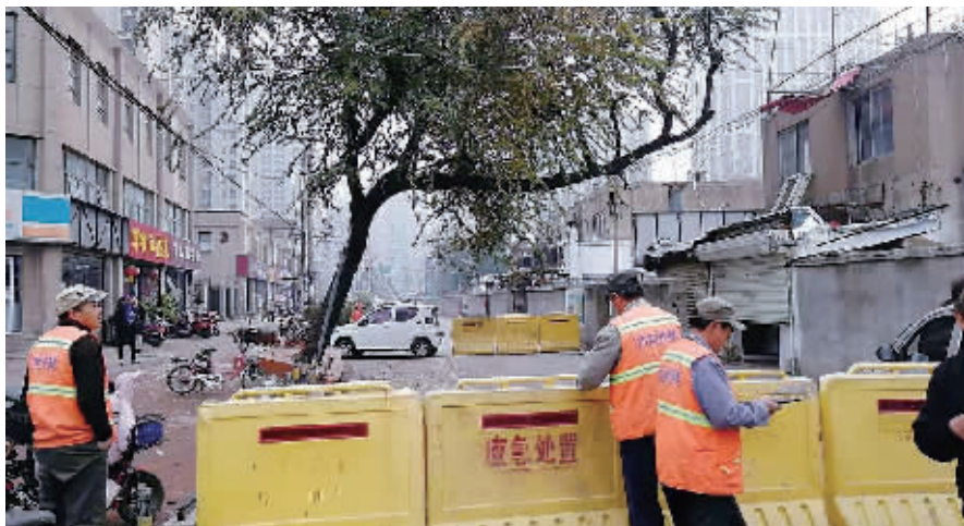
西阁街出现一处路面沉降,市政管理处第一时间赶到现场处置。

事故进行事后勘察和分析,认为我市发生的道路塌陷主要原因有地下水超采,地下轨道交通密集建设,反复开挖道路铺设地下管网,老旧管线破裂、渗漏水等。这些因素使得城市地下存在空洞、不密实区域等隐患,当隐患发展到一定程度或者面临极端天气状况时,路面结构层支撑不住,就会发生塌陷事故。