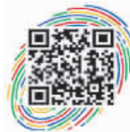
徐州城管微博二维码