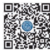
徐州城管微信二维码