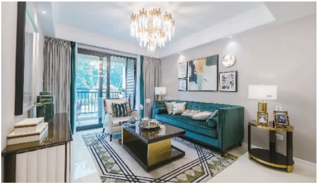
徐州 融创·玉兰公馆样板房实景图

“当市场回归理性时,我们应该理性鉴赏产品。”融创徐州项目负责人说,交付样板可以让业主看到未来实际交付的房屋真实情况,以最直接的方式提前呈现。工法样板房则更像一本教科书,层层剖析建筑的肌理,将