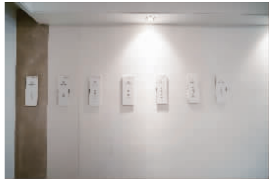
徐州 融创·玉兰公馆工法样板房实景图

产品深入分析和展示,从根本上让业主了解肉眼看不到的背后结构。“建筑内在肌理的匠心构筑,才是品质实力的呈现。”