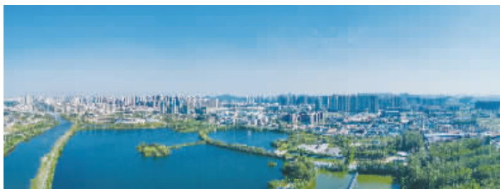
桃花源湿地公园(在建中)实景图

融创·玉兰公馆和融创·淮海壹号都是以桃花源湿地为中心打造。融创致力于大地块运营,未来更将围绕着约1600亩的桃花源湿地打造更多高端产品,向徐州人兑现美好湖居生活。