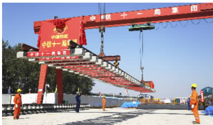
徐州地铁2号线第一幅轨排成功上线。