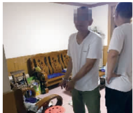
嫌疑人指认作案现场